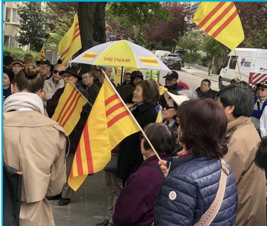
Cộng Đồng Việt Nam Tự Do tại Vương Quốc Bỉ tổ chức biểu tình Ngày Quốc Hận - Ngày 30 Tháng 4 Năm 2024.