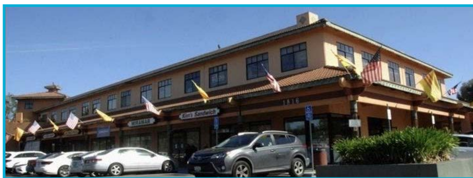
Quốc Kỳ Việt - Mỹ được treo tại khu thương mại đường Tully, San Jose

Đến hai giờ chiều cùng ngày thì các khu phố chính của người Việt đã rợp bóng cờ Vàng chuẩn bị cho hàng loạt các sinh hoạt tưởng niệm tháng Tư đen như Lễ Thượng Kỳ rồi để cờ rủ của Tập Thể Quân Đội, Sinh hoạt Hội thảo do các đoàn thể trẻ tổ chức.