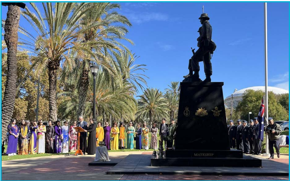
Cộng Đồng Người Việt Tự Do Nam Úc tổ chức Tưởng Niệm Quốc Hận tại Tượng Đài Việt Úc - ngày 27 tháng 4 năm 2024