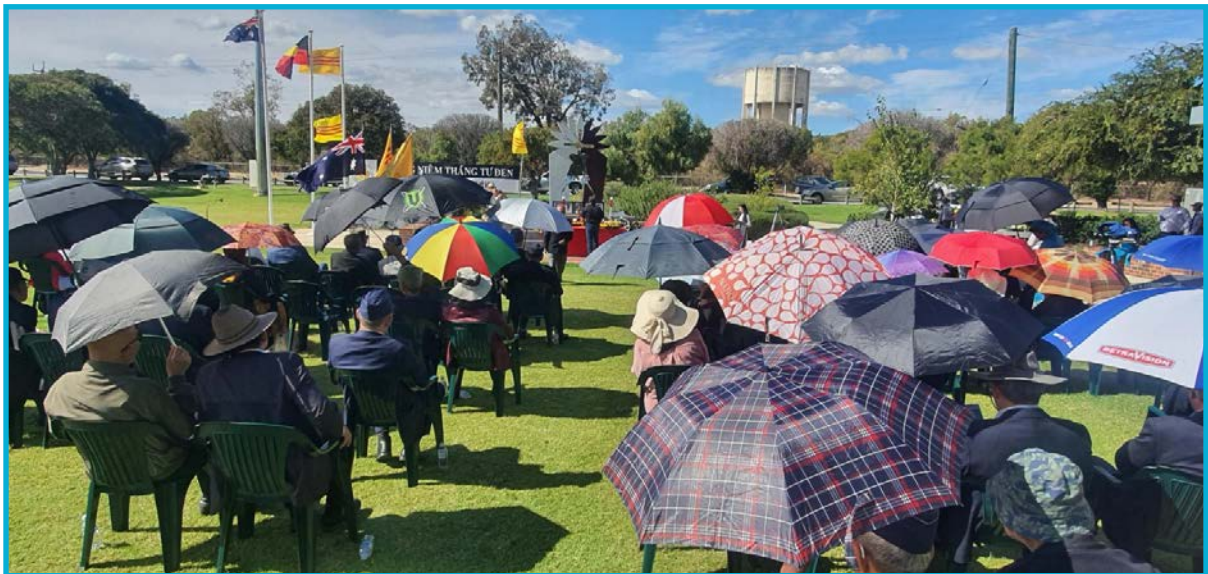
Cộng Đồng Người Việt Tự Do Tiểu Bang Tây Úc tổ chức Ngày Quốc Hận 30/4 tại thành phố Perth - ngày 30 tháng 4 năm 2024