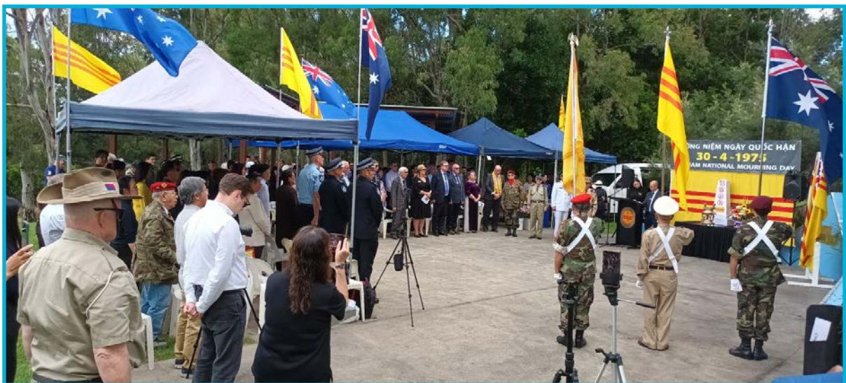
Cộng Đồng Người Việt Tự Do Tiểu Bang Queensland tổ chức Ngày Quốc Hận 30/4 tại Freedom Plaza, thành phố Brisbane – ngày 30 Tháng 4 Năm 2024