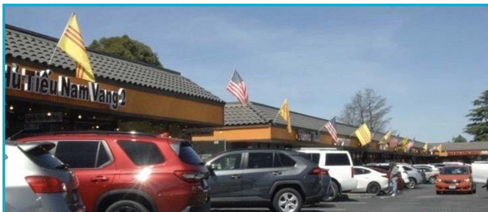
Quốc Kỳ Việt - Mỹ được treo tại khu thương mại đường Senter, San Jose