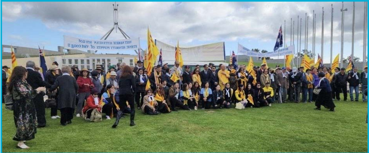
Ủy Ban Người Úc Gốc Việt Tự Nạn Cộng Sản tổ chức biểu tình Tưởng Niệm 30/4 trước Tiên Đình Quốc Hội Liên Bang Úc, Thủ Đô Canberra – ngày 30 tháng 4 năm 2024