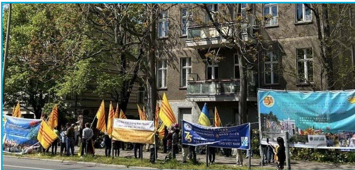
Liên Hội Người Việt Tỵ Nạn Cộng Sản tại Liên Bang Đức tổ chức biểu tình Ngày Quốc Hận 30/4, trước Tòa Đại sứ CSVN tại Thủ đô Berlin, Đức - ngày 27 tháng 4 năm 2024