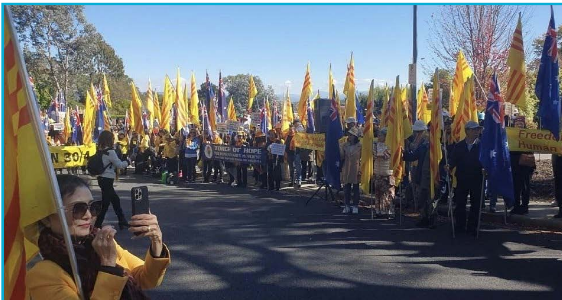
Cộng Đồng Người Việt Tự Do Liên Bang Úc Châu tổ chức biểu tình Ngày Quốc Hận 30/4 trước Tòa Đại Sứ CSVN, Thủ Đô Canberra, Úc Châu - ngày 27 tháng 4 năm 2024