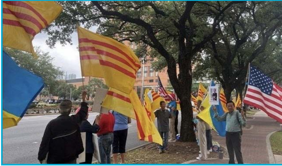
Một góc đoàn biểu tình trước Tổng Lãnh Sự Quán CSVN tại TP. Houston