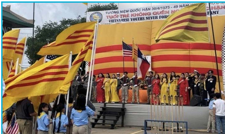
Lễ Tưởng Niệm 30/4 tại Houston - Tuổi Trẻ Không Quên Ngày Quốc Hận

Xen kẽ phần phát biểu là một chương trình văn nghệ với những bài hát đấu tranh đã gợi nhớ cho mọi người về một chặng đường đấu tranh hào hùng và bất khuất của dân tộc trong nhiều thập niên qua.