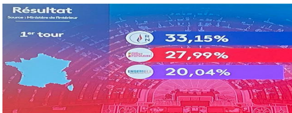
Bầu cử Quốc Hội vòng một hôm 30/6/2024

Ngoài ra... có tin đồn, E. Macron chơi một "chường" rất cao, ông nghĩ rằng nhóm Cực Hữu của bà Marine Le Pen không có kinh nghiệm để điều khiển quốc gia, nên để cho phe này nắm chính quyền trong 2 năm tới là một cơ hội cho người dân thấy sự "lúng túng" và "thiếu khả năng" của nhóm cực Hữu để kỳ bầu cử Tổng Thống năm 2027 dân Pháp sẽ không bỏ phiếu cho họ.