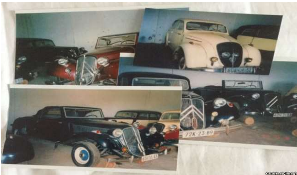
Bộ sưu tập xe-một trong số rất nhiều tài sản của ông Bình tại Việt Nam.

Tuy nhiên, sự thành công quá nhanh của ông Bình tại Việt Nam đã gây ra “sức cuốn hút không bình thường”, theo lời của cựu Đại sứ Việt Nam. Ông bị rơi vào những cái “bẫy” của các thế lực “đục nước béo cò”.