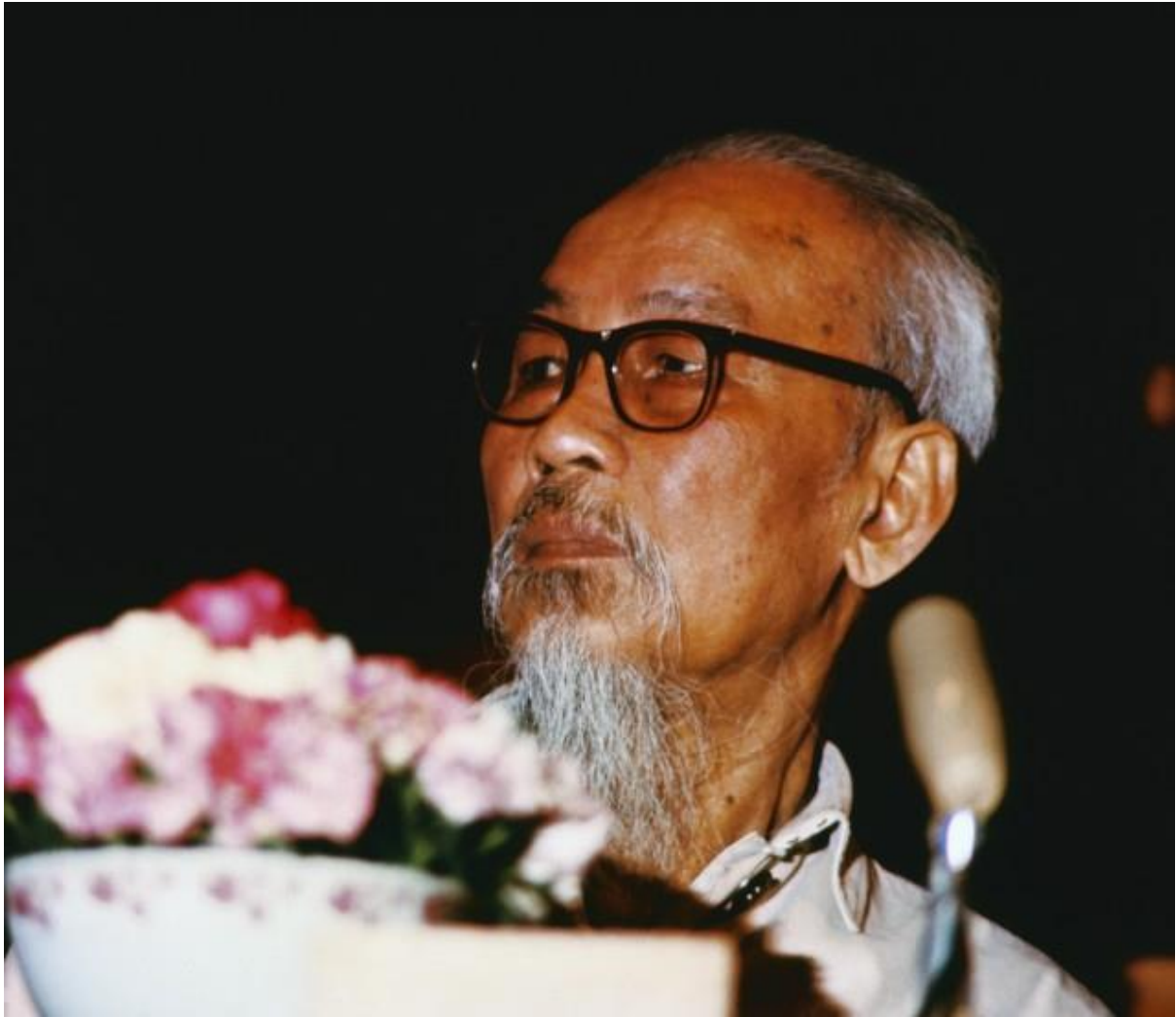
29 May 1969, Hanoi, North Vietnam — Hanoi, N. Vietnam: Ho Chi Minh, President of North Vietnam.

Những bức ảnh màu trên cho thấy một sự thật rất rõ nét về nhân vật có tên hồ chí minh. Một tên đảng viên đảng cộng sản Trung Quốc được đảng cộng sản Việt Gian lừa phỉnh dân Bắc Kỳ một cách ngoạn mục!!!