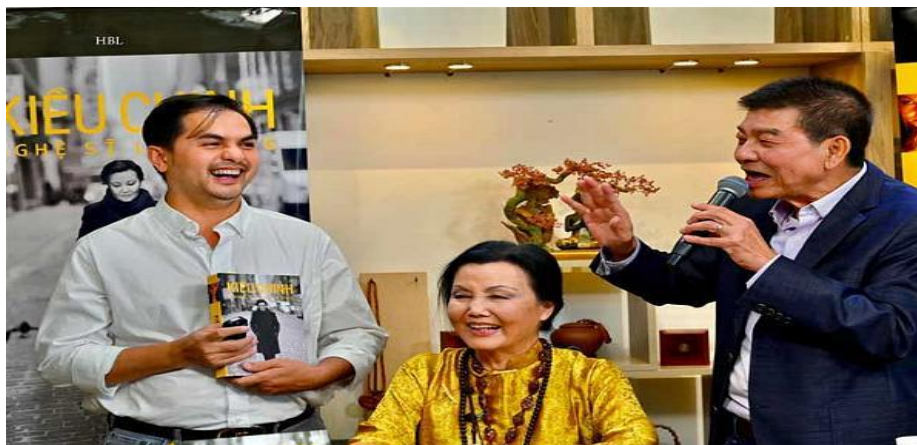
DQAThái, KChinh, Diễn viên Đức Tiến

- Hôm nay là ngày RMS hồi ký của Kiều Chinh tại nhà sách Tự Lực mà thời tiết lại rất đẹp và ấm áp. Bà là 1 tên tuổi khá quen thuộc với cộng đồng người Việt chúng ta tại hải ngoại. Bà đã có khá nhiều đóng góp trong nền điện ảnh tại VN và Hoa Kỳ. Tôi thật vui khi có đông đảo mọi người, nhân văn thi hữu và các đồng hương yêu mến bà đều hiện diện. Điều này cho thấy rằng sự đóng góp của nữ tài tử KC trong điện ảnh đã được cộng đồng ghi nhận.