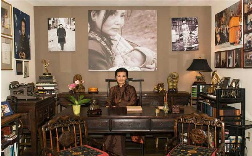
KChinh tại nhà riêng.