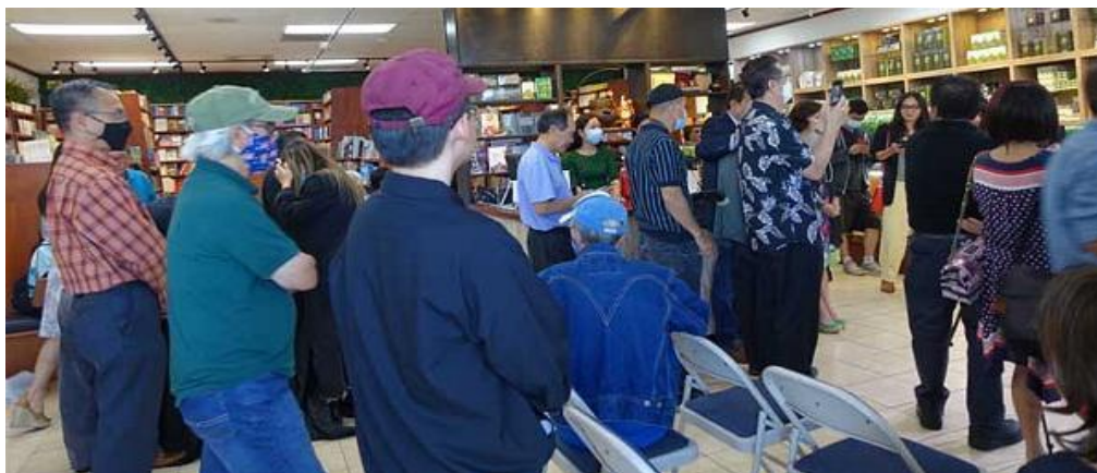
Quang cảnh buổi RMS

Sau hai buổi ra mắt sách tại tiểu bang Washington DC và Houston, Texas, nữ tài tử Kiều Chinh đã trở về Quận Cam, California để ra mắt sách tại đây vào ngày 10 tháng 10, 2021. Buổi ra mắt cuốn hồi ký "Kiều Chinh-Nghệ Sĩ Lưu Vong" được tổ chức tại nhà sách Tự Lực thành phố Little Saigon trong vòng 2 tiếng đồng hồ vào buổi trưa. Nét đẹp, tài năng và sự nghiệp thành công đã làm nhiều người biết đến và bà nổi danh như còn.