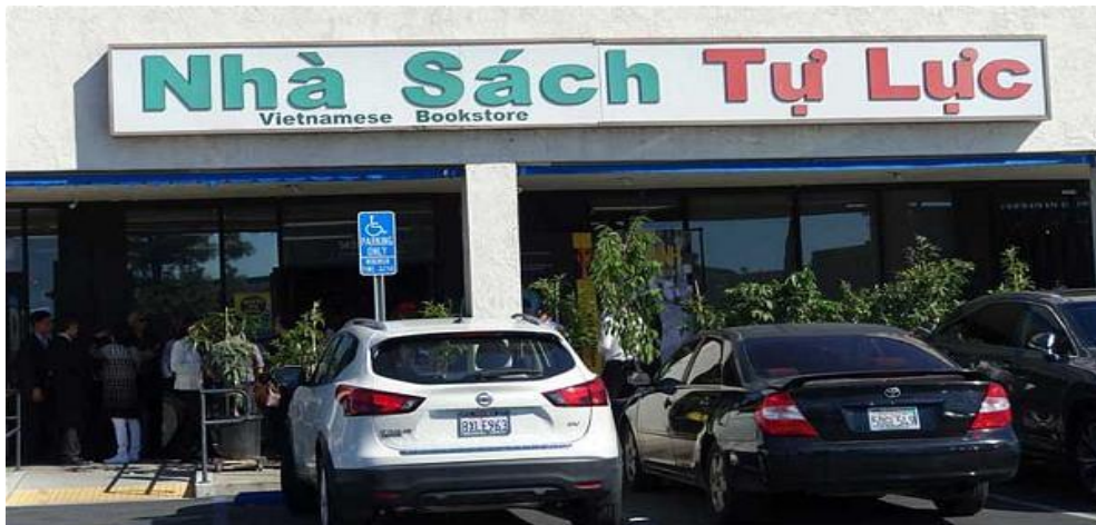
Nhà sách Tự Lực

-Ngày 15 tháng 3 năm 2021, tại thành phố Los Angeles , bang California , Hoa Kỳ , Kiều Chinh đã vinh dự nhận giải thưởng Thành tựu trọn đời do Ban tổ chức Liên hoan phim Thế giới Châu Á (AWFF) trao tặng.