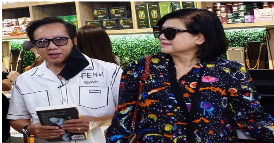
Vợ chồng ca sĩ Elvis Phương