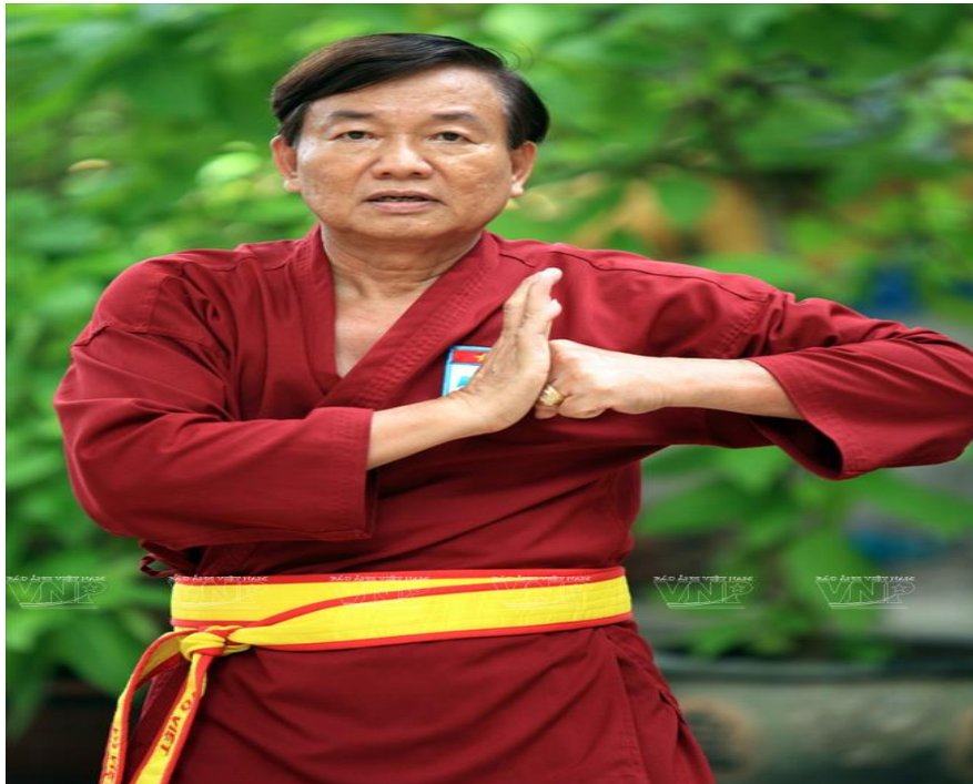
Hàng ngày ông vẫn say sưa luyện tập, đam mê với nghiệp võ.