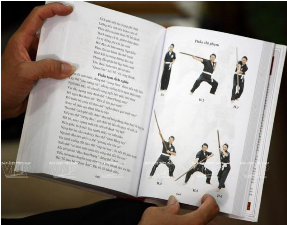
Cuốn sách có tập hợp những bài võ nổi tiếng trong làng võ cổ truyền Việt Nam.