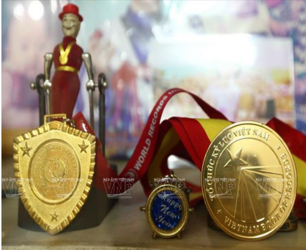
Tháng 4/2013, võ sư Phạm Phong được Tổ chức kỷ lục Việt Nam cấp bằng kỷ lục: “Người viết sách lịch sử võ học Việt Nam đầu tiên”.