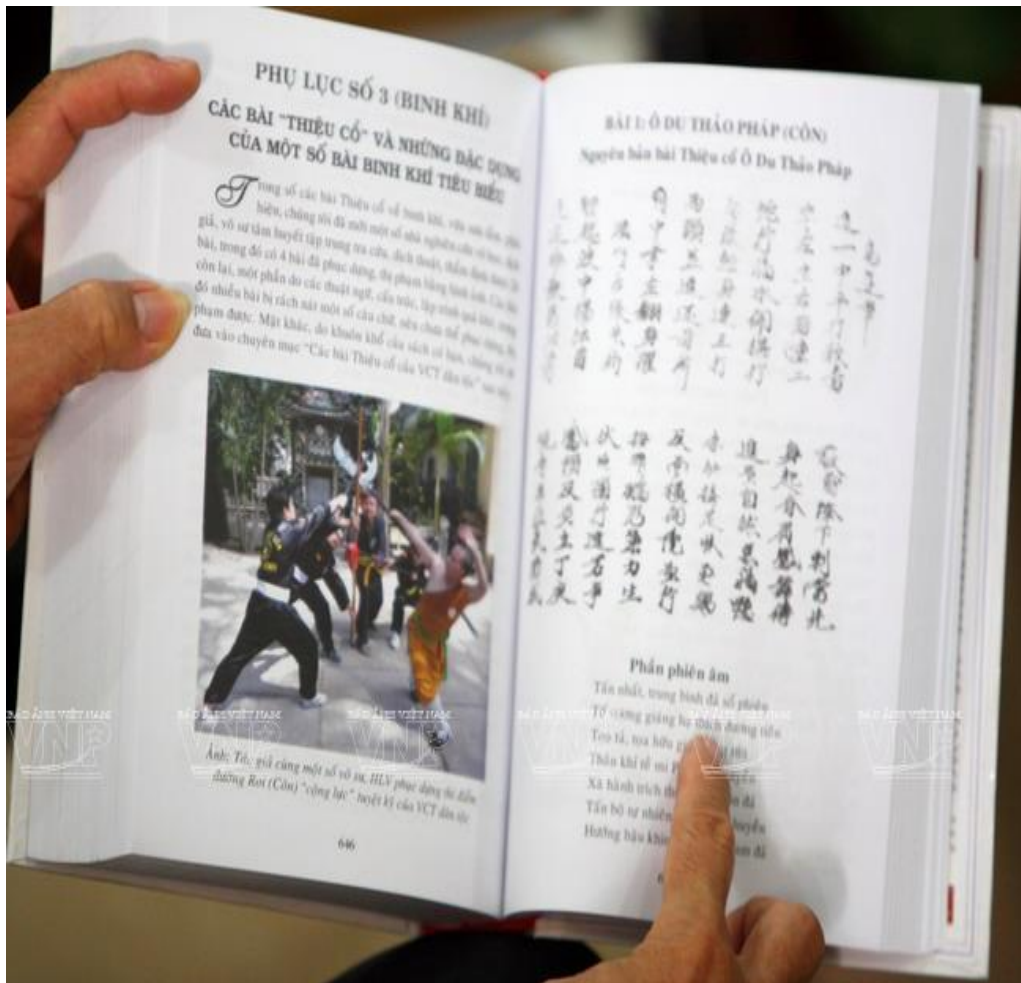
Các bài võ, bài binh khí cổ xưa được ông sưu tầm đưa vào sách là một nguồn tư liệu vô cùng quý giá về võ học Việt Nam.