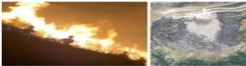
(Rủi ro cháy rừng)

Sự kết hợp của nhiều vật liệu ô nhiễm bị cháy khiến các vụ cháy rừng gây ô nhiễm không khí nhiều hơn so với phát thải công nghiệp Cháy rừng gây ô nhiễm không khí do phát tán một lượng bụi siêu mịn vào không khí. Ngoài ra, sự kết hợp của nhiều vật liệu ô nhiễm bị cháy khiến các vụ cháy rừng gây ô nhiễm không khí nhiều hơn so với phát thải công nghiệp.