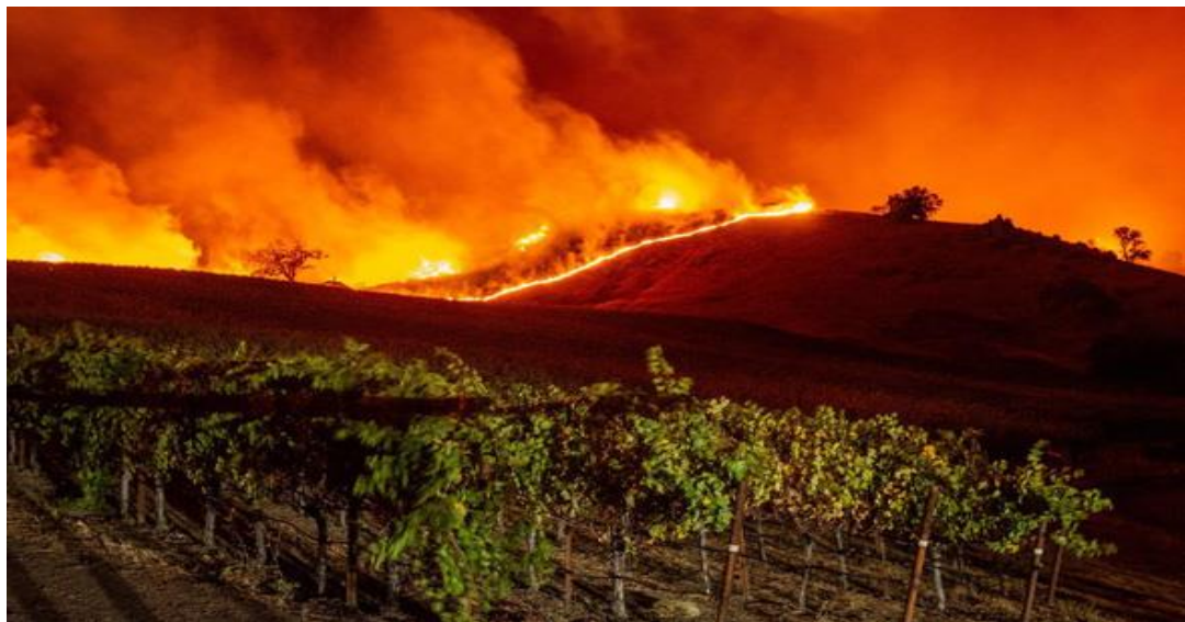
Cháy rừng trên một sườn đồi ở Geyserville, California tháng 10-2019

Ở bờ tây nước Mỹ, theo Cơ quan Hàng không và vũ trụ Mỹ (NASA), số vụ và diện tích rừng bị cháy tăng không ngừng kể từ những năm 1950.