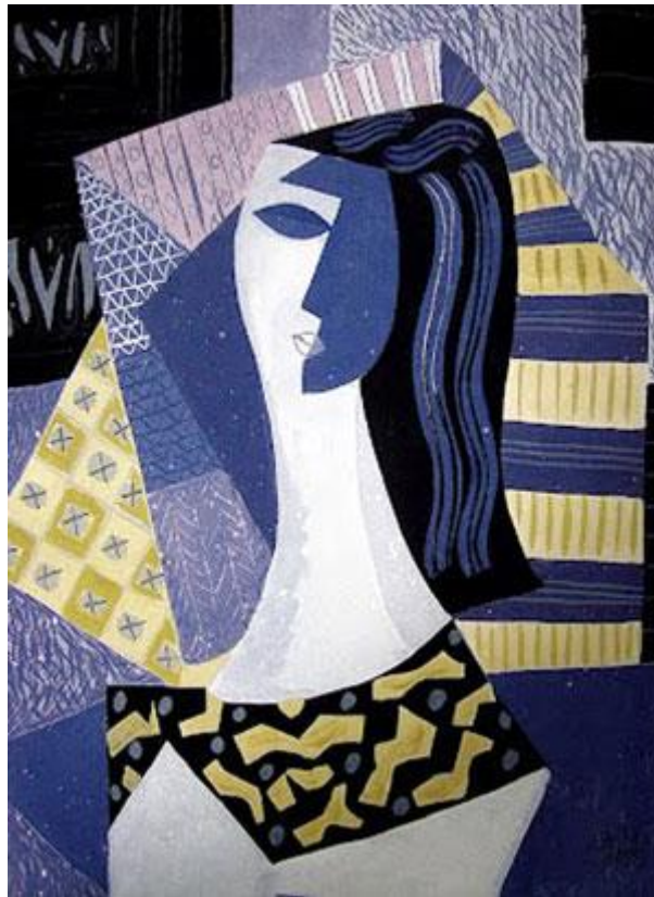
Thiếu nữ khăn choàng - Tạ Ty - sơn dầu trên canvas