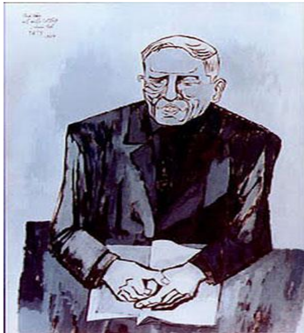
Vũ Khắc Khoan