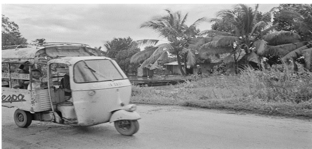
Xe lam Cần Thơ – Phụng Hiệp