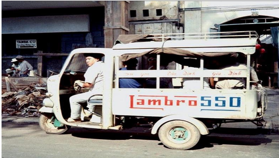
Xe chở khách Lambro 550 ở Sài Gòn