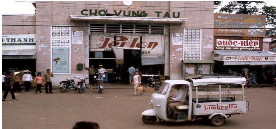
Xe lam tại chợ Vũng Tàu