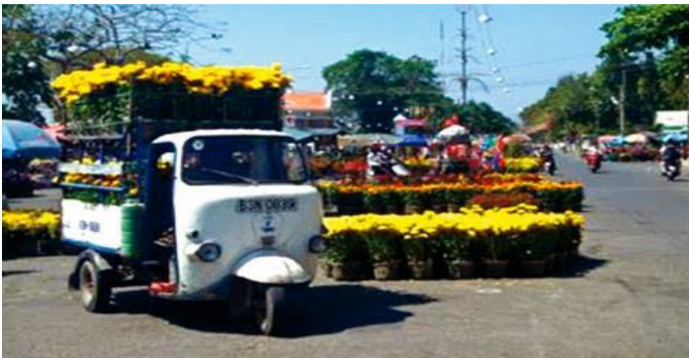
Xe lam chở hoa vào ngày tết