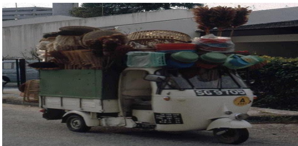
Xe lam tại Vũng Tàu năm 1967