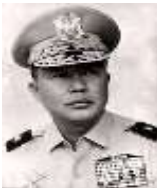
Chuẩn Tướng TRẦN VĂN HAI

THÁNG TƯ ĐEN, XIN THẤP NÉN HƯƠNG TƯỞNG NIỆM CHUẨN TƯỚNG TRẦN VĂN HAI, MỘT TRONG NHỮNG VỊ ANH HÙNG CỦA DÂN TỘC VIỆT NAM ĐÃ TUẦN TIẾT NGÀY MIỀN NAM BỨC TỬ 30/4/1975