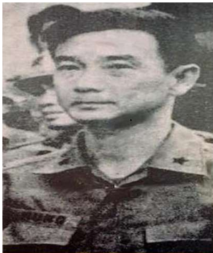
Chuẩn Tướng LÊ VĂN HƯNG (1933-1975)

THÁNG TƯ ĐEN, XIN THẮP NÉN HƯƠNG TƯỞNG NIỆM CHUẨN TƯỚNG LÊ VĂN HƯNG, MỘT TRONG NHỮNG VỊ ANH HÙNG CỦA DÂN TỘC VIỆT NAM ĐÃ TUẤN TIẾT NGÀY MIỀN NAM BỨC TỬ 30/4/1975