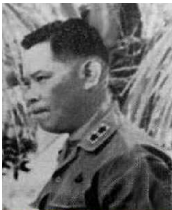
Thiếu Tướng NGUYỄN KHOA NAM (1927-1975) www.vietnamvanhien.net