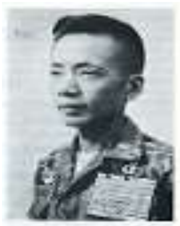
Thiếu Tướng PHẠM VĂN PHÚ

THÁNG TƯ ĐEN, XIN THẮP NÉN HƯƠNG TƯỞNG NIỆM THIẾU TƯỚNG PHẠM VĂN PHÚ, MỘT TRONG NHỮNG VỊ ANH HÙNG CỦA DÂN TỘC VIỆT NAM ĐÃ TUẦN TIẾT NGÀY MIỀN NAM BỨC TỬ 30/4/1975