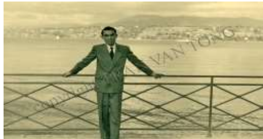
Trần Văn Văn -Genève 1954

Năm 1954 cụ Ngô Đình Diệm về nước thụ chức Thủ Tướng, có mời cụ tham chính nhưng cụ từ chối. Tuy nhiên, vào tháng 7/1954 Cụ tham dự Hội nghị Genève về Việt Nam mà ngoại trưởng Trần Văn Đỗ là đại diện của chánh phủ Ngô Đình Diệm. (hồi ký cụ bà Trần Văn Văn.)