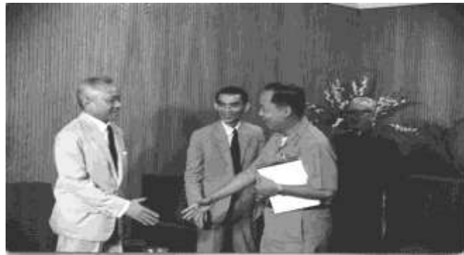
Mai Thọ Truyền, Trần Văn Văn, Nguyễn Khánh, Phan Khắc Sửu - Dinh Gia Long 1965

Ngày 1/11/1963 một nhóm quân nhân do tướng Dương Văn Minh cầm đầu, đảo chánh. Tổng Thống Ngô Đình Diệm và ông Cố vấn Ngô Đình Nhu bị sát hại.