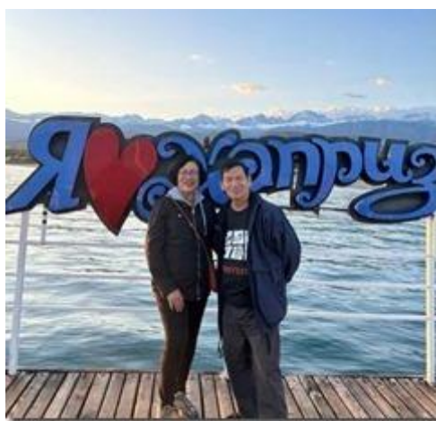
I Love Kapriz.

(Ở đây chữ X của mẫu tự Cyrillic = chữ K mẫu tự ABC).