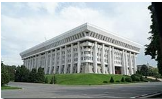
Nhà Trắng, Dinh tổng thống Kyrgyzstan, xây theo kiểu kiến trúc Stalin của Nga.

Cuối cùng người biểu tình chiếm Nhà Trắng (White House), dinh tổng thống.