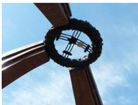
Chòm tunduk nhà lều yurt là vòng hoa tang.

Đỉnh lều là vòm tunduk hình vòng hoa tang được giữ bởi ba khuôn sườn lều bằng đá hoa cương.