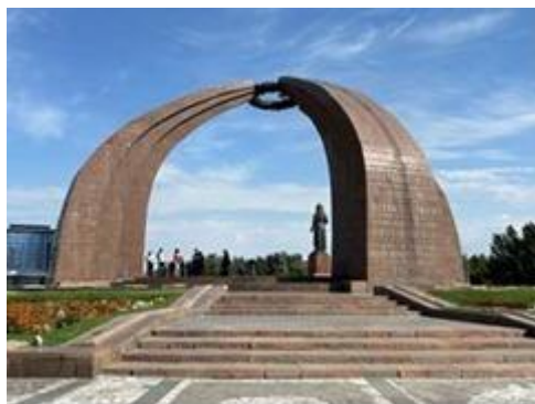
(ảnh của tác giả).

Quảng trường uy nghi rộng lớn xây năm 1985 tưởng niệm năm thứ 40 ngày chiến thắng Đức Quốc Xã, chấm dứt Thế Chiến Thứ II. Đài tưởng niệm diễn đạt một người thiếu phụ đứng trước hiên lều yurt chờ chồng đi chinh chiến xa trở về.