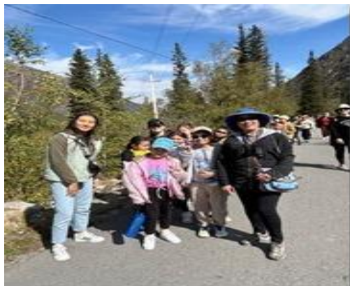
Các em học trò đi dã ngoại.

Sau công viên này chúng tôi rời Kyrgyzstan hướng về Amalty, thủ đô cũ của Kazakhstan.