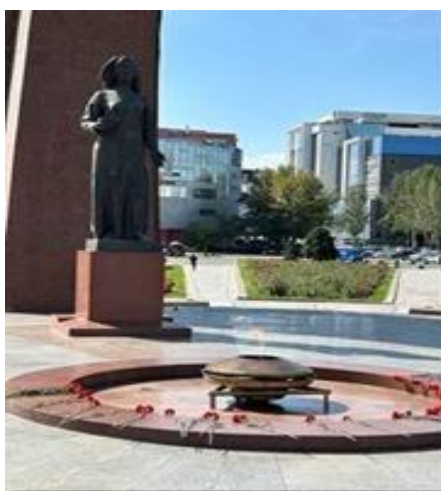
Thiếu phụ chờ 'Người Chinh Phu Về'.