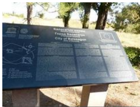
Phế tích thành phố Balassagun.

Quần thể tháp gồm tháp cộng với các bia mộ, phần còn lại của lâu đài và ba lăng mộ là phế tích của thành phố cổ Balasagun (của người Sogdia gốc người Iran). Cũng nên biết người Sogdian là người giữ một vai trò trung gian phát triển tốt độ của nền giao hảo giữa Đông và Tây của Con Đường Tơ Lụa. Họ rất tinh thông, khéo léo trong giao thương và có đầu óc cởi mở chấp nhận tất cả những dị biệt của các nền văn hóa khác kể cả các tín ngưỡng.