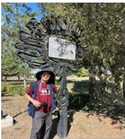
Đường vào tháp. Tượng Người Mặt Trời.

Trạm dừng lại đầu tiên là ghé thăm Tháp Burana. Đây là một tháp cổ, lớn ở Thung Lũng Chuy ở phía bắc Kyrgyzstan gần tỉnh Tokmok (Tổ Diệp). Nghe nói Tokmok là nơi sinh của nhà thơ Lý Bạch. Không biết có còn dấu tích gì của nhà thơ không? Đi với nhóm nên không thể đi tìm kiếm riêng được.