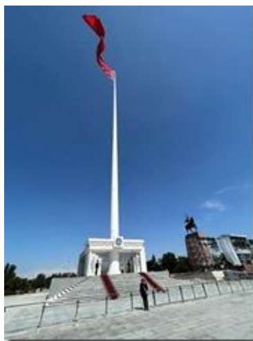
Cột Cờ vĩ đại và tượng Manas.

Nổi bật nhất của quảng trường là trụ cờ cao vút lên trời và pho tượng Dũng mãnh Manas.