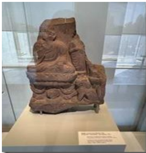
Một pho tượng Phật Trung Á.

Thầy Huyền Trang cũng ở vào thời nhà Đường nên cũng gọi là Đường Tăng theo Con Đường Tơ Lụa đi Tây Vực vượt qua rặng Thiên Sơn đã tới Kyrgyzstan và lưu lại tại các ngôi chùa tại đây.