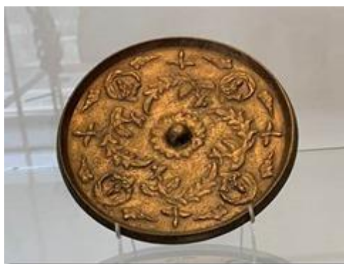
Một gương đồng Trung Hoa.

Con Đường Tơ Lụa bắt đầu có từ Thời Tây Hán (202 Trước Dương Lịch-9 Sau Dương Lịch) nhưng tới thời nhà Đường thì sự giao lưu mới đạt tới đỉnh cao nhất. Gương đồng vì thế cũng đạt tới một đỉnh cao của sự phát triển. Gương đồng đời Đường dày với trang trí thanh tao. Qua con Đường Tơ Lụa, đã tiếp xúc và giao lưu văn hóa với các quốc gia Trung Á, Ba Tư, Ai Cập, Ấn Độ, nhiều yếu tố mỹ thuật mượn từ phương Tây bắt đầu xuất hiện trong các thiết kế Trung Hoa như các dây nho, hoa lá lạ, chim muông và dát chỉ bạc, khảm pha lê, ngọc trai... cũng thấy trên gương đồng. Ở gương đồng ở trên ta thấy rõ có những trang trí lạ như chim nước đuôi ngắn, chim phượng và những hình giống như ‘đồng tiền kim loại’... Chim nước và chim phượng lửa mang dịch tính nòng nọc (âm dương) (xem Gương Đồng Trung Quốc Một Khuôn Mặt Đối Cực Nòng Nọc, Âm Dương với Trống Đồng Đông Sơn 1., Giải Đọc Trống Đồng Đông Sơn).