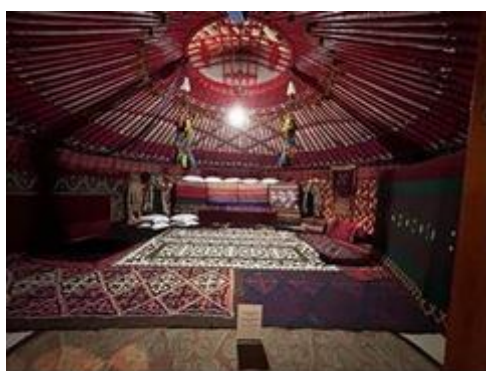
Chòm lều tunduk.

-Trong mặt trời là vòng vương miện gỗ màu đỏ với hai bộ 4 đường cong tạo thành chữ thập cong gọi là tunduk của mái nhà lều cổ truyền yurt, dùng như là lỗ thông hơi, ống khói. Yurt có thể tháo gỡ ra mang theo đi được của các tộc du mục sống ở các vùng đồng cỏ, thảo nguyên Trung Á (Cũng thấy ở Mông Cổ).