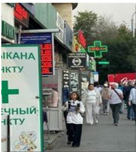
Dãy phố tiệm thuốc Tây.

Ở đây có một điều ngạc nhiên là tiệm thuốc Tây nhan nhản như tiệm tạp hóa. Có nơi một dãy ba bốn tiệm nằm sát vách nhau.