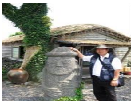
Thần tổ Dol Hareubang hình Người Dương Vật (Dol là đá, hareubang là ông hay người già, ông tổ) ở Đảo Tế Châu, Nam Hàn.