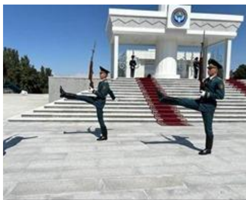
Đội gác.

Hãy tính giờ tới đây để xem lính đội phiên gác với những bước ‘chân ngỗng’ (goose-stepping) chậm rãi của Nga.