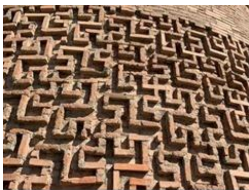
Trang trí hình học ở phần giữa tháp.

Sau nhiều lần bị động đất ngày nay chỉ còn một nửa cao 25 m (82 ft).