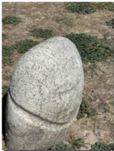
Tượng Tổ Tiên hình nô.

Ví dụ như Thần Tổ Tiên hình nô cũng thấy ở Peru: