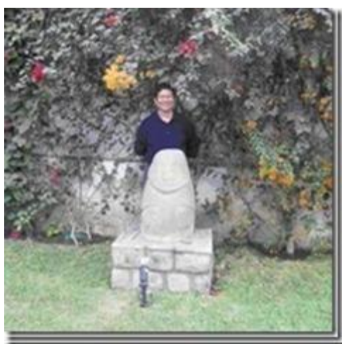
Tác giả chụp với tượng đá tạc thần tổ dương vật tại khu vườn Viện Bảo Tàng Larco, Lima, Peru.

Ví dụ như Thần Tổ Tiên hình nô cũng thấy ở Peru: