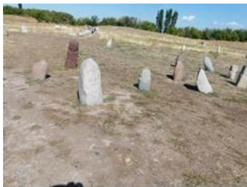
Các Tượng Bia Đá Tổ Tiên Balbals.

Ngoài tháp ra ở đây còn trưng bày các tượng đá gọi là Balbals hay bia đá Kurgan, tiếng Turc balbal có nghĩa là tổ tiên, tiền nhân.