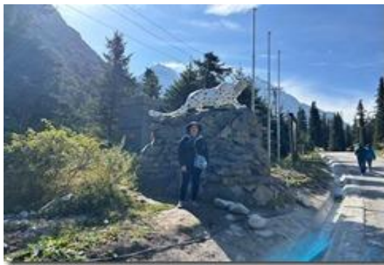
Cổng vào công viên với tượng con báo tuyết (snow leopard).

Loài báo trắng này có mặt tại đây, loài này sống ở các rặng núi tuyết cao từ Trung Á cho tới Himalaya. Báo có đốm tròn hay đốm hoa đặc thù của từng con giống như dấu tay người. Đuôi dẹt như quả lắc để giữ thăng bằng trên vách núi tuyết. Điều mơ ước của những người đi hoang dã tại đây là thấy được một con báo này. Hình con thú trắng với chữ Bishkek chụp ở phi trường nói ở trên chính là con báo trắng này.