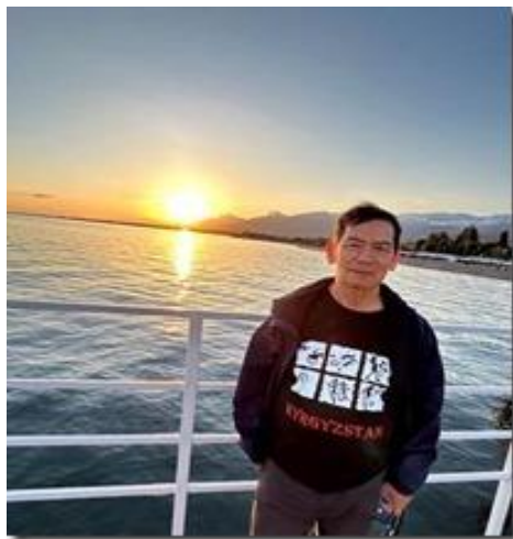
Hoàng hôn trên Hồ Issyk Kul.