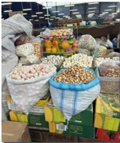
Những viên 'ô mai' cheese mặn kurt.

Những cục phô-mai (cheese) có cho muối mặn (như ô mai) mà những dân du mục chăn thú dùng làm món ăn dặm (snack). Chăn nuôi nhiều nên có nhiều bơ sữa, thừa làm cục cheese khô (kurt ruột thịt với Anh ngữ curd, sữa đóng cục, cùng âm với Việt ngữ cục). Tôi đã nếm thử trong bữa ăn sáng ở khách sạn. Nhưng thấy mặn quá đối với tôi, một bác sĩ chuyên khoa về Thận và Cao Máu.