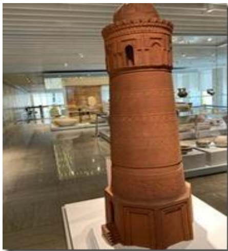
Mô hình tháp nguyên thủy