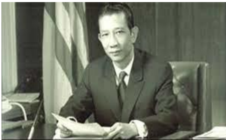
Bùi Diễm đã vĩnh viễn ra đi sau khi đã cố gắng làm tất cả những gì ông thấy là đúng cho đất nước.

Tôi gặp Bùi Diễm lần đầu tại phi trường Orly Paris năm 1968, hình như là ngày 10 tháng 5. Trước đó tôi đã được nghe nói về ông như một nhân vật rất có tài, con của cụ Bùi Kỳ, người dịch Bình Ngô Đại Cáo sang chữ Nôm và cháu của học giả Trần Trọng Kim, tác giả Việt Nam Sử Lược và cựu thủ tướng Việt Nam sau ngày Nhật đảo chính chấm dứt thời kỳ Pháp thuộc. Tôi cũng được biết là ông tham gia Đại Việt Quốc Dân Đảng rất sớm và trở thành người thân tín của lãnh tụ Trương Tử Anh.