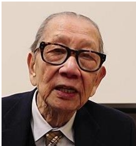
Bùi Diễm vào năm 2019

Bùi Diễm (1 tháng 10 năm 1923 [1] – 24 tháng 10 năm 2021) là một chính khách Việt Nam. Ông làm Đại sứ Việt Nam Cộng hòa ở Hoa Kỳ từ 1967 đến 1972 .