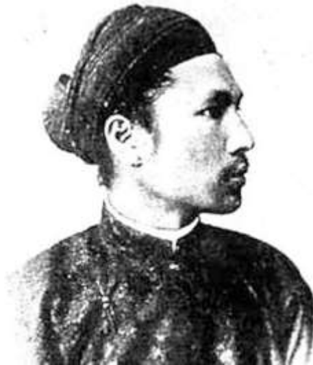
Vua Hàm Nghi (1871-1943)