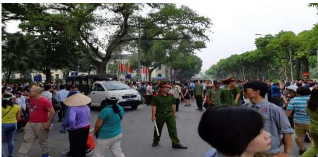
Công an theo dõi người biểu tình ở Hà Nội vào ngày 10 tháng 6 năm 2018.