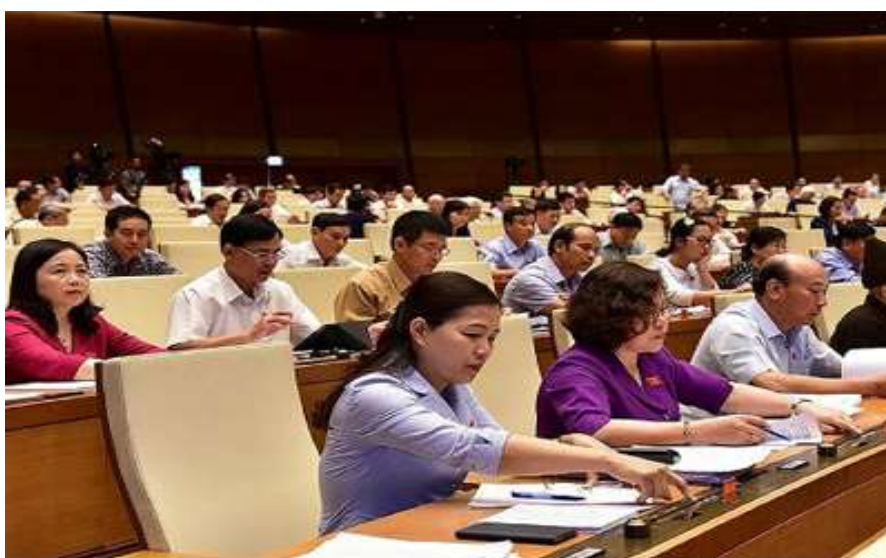
Các đại biểu Quốc hội Việt Nam bấm nút thông qua Luật an ninh mạng ngày 12 tháng 6 năm 2018.

Bản yêu sách nêu rõ việc Nhà nước Việt Nam thực hiện Yêu sách 8 điểm 2019 về các quyền căn bản nói trên của người dân là con đường duy nhất đưa Việt Nam thoát khỏi thực trạng trì trệ về kinh tế, thối nát về chính trị xã hội, nguy cơ đánh mất chủ quyền quốc gia vào tay ngoại bang; để từng bước phát triển bền vững, thực hiện mục tiêu “dân giàu, nước mạnh, xã hội dân chủ, công bằng, văn minh.”