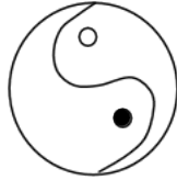
Hình Thái Cực

Đồ hình Thái Cực mang tượng ý “ Lưỡng nghi nhị hóa sinh trong Thái Cực ”