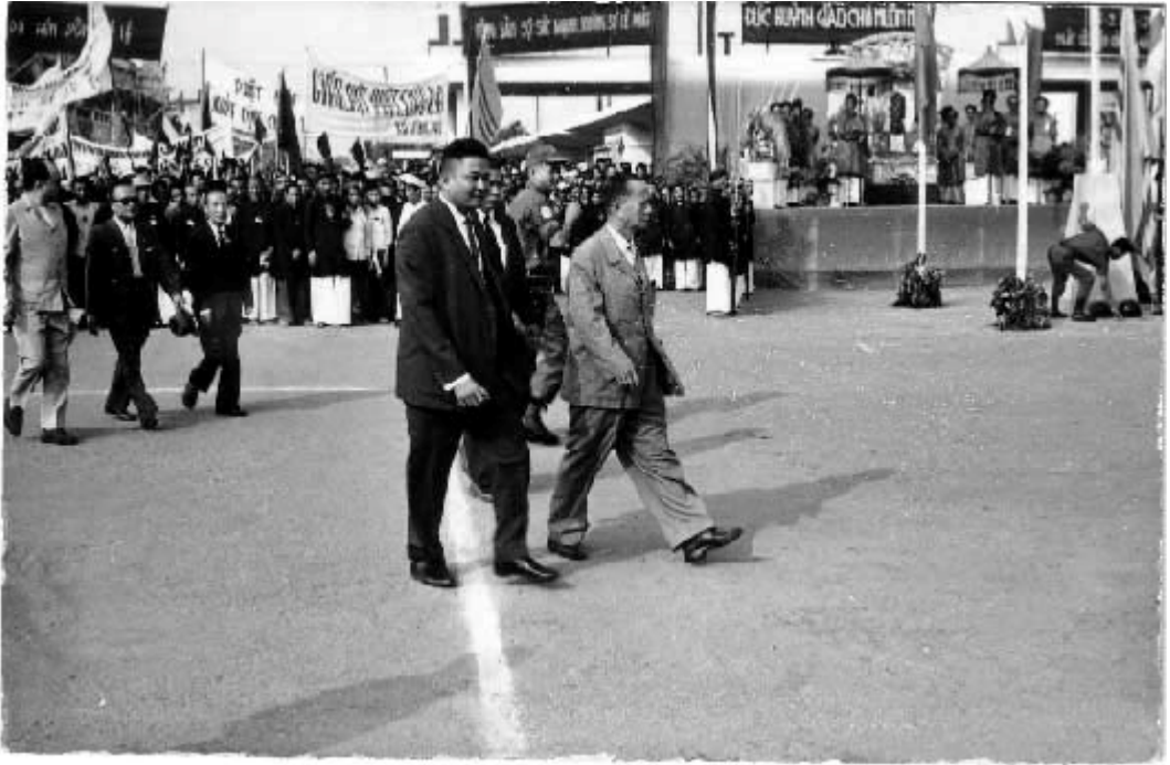
Hội kiến với Đức Bà và đại diện PGHH :

Một cuộc hành hương quan trọng khác, tại Thánh Địa Phật Giáo Hoà Hảo, nhân lễ tưởng niệm Đức Thầy thọ nạn: