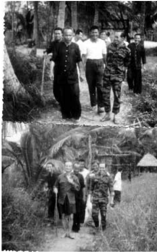
Năm 1970, kinh lý Kiến Hoà :

Trên con đường tìm lại tự do với bạn tù tử tội: (cụ chống gậy ở hình dưới)