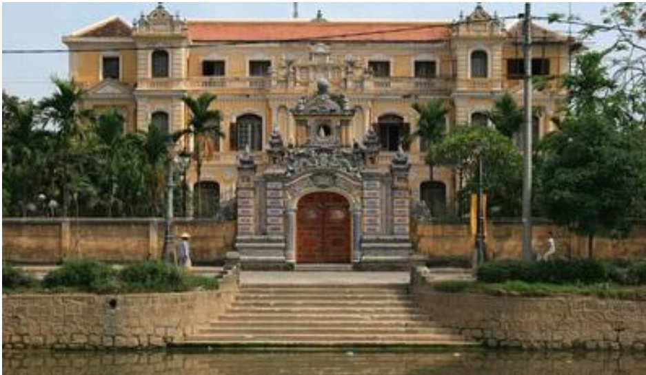
An Định Cung, bên bờ sông An Cựu, số 97 Phan Đình Phùng, Huế được Vua Khải Định xây dựng xong năm 1919.