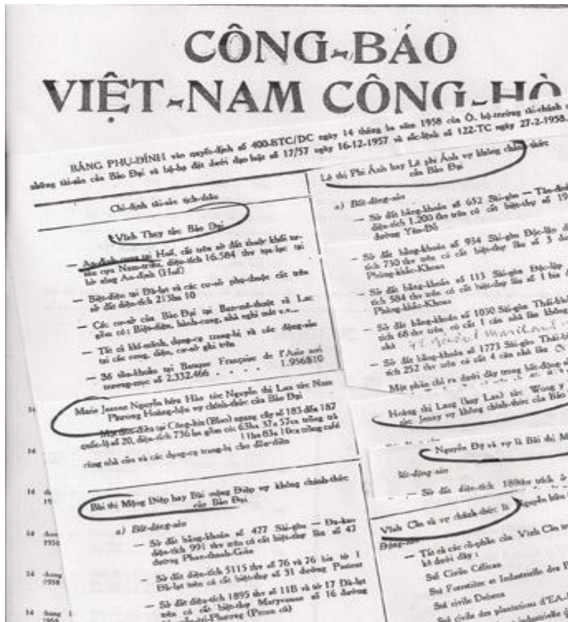
Công báo VNCH ngày 22 Tháng Ba 1958.

Ông Bảo Ân đã cho chúng tôi xem một tài liệu cũ mà ông đã lưu giữ từ 56 năm qua, tờ Công Báo Việt Nam Cộng Hòa ngày Thứ Bảy 22 Tháng Ba 1958, ấn hành bởi tòa tổng thư ký Phủ Tổng Thống, “bảng phụ đính vào quyết định số 400.BTC/DC ngày 14 Tháng Ba 1958 của ông bộ trưởng tài chính chỉ định những tài sản của Bảo Đại và bộ-hạ đặt dưới đạo luật số 17/57 và 16-2-1957 và sắc lệnh số 122-TC ngày 27-02-1958 chỉ định tài sản tịch thu” của: