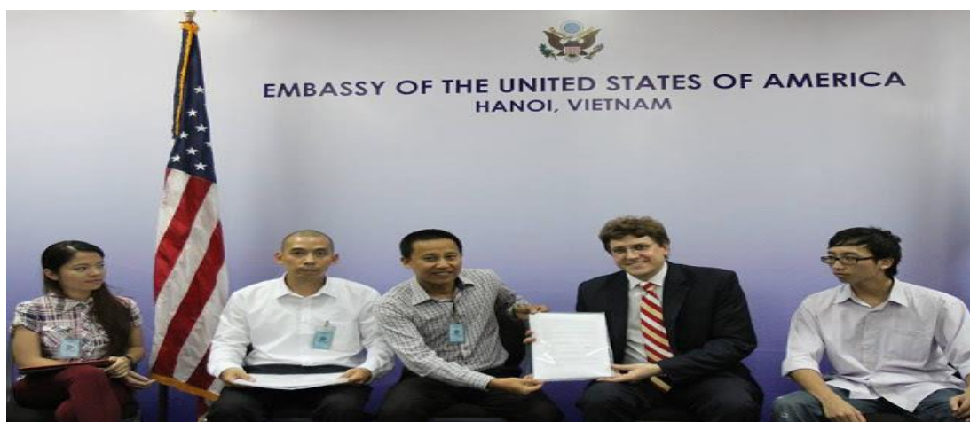
Mạng lưới blogger Việt Nam

Vào 2h chiều ngày thứ tư, 24/7/2013, một số blogger đã có cuộc gặp với Đại sứ quán Mỹ tại Hà Nội để trao bản Tuyên bố của mạng lưới blogger Việt Nam, gọi tắt là Tuyên bố 258.