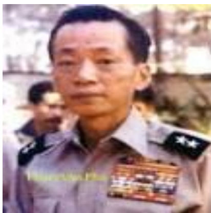
(H: Thiếu Tướng Phạm Văn Phú ).