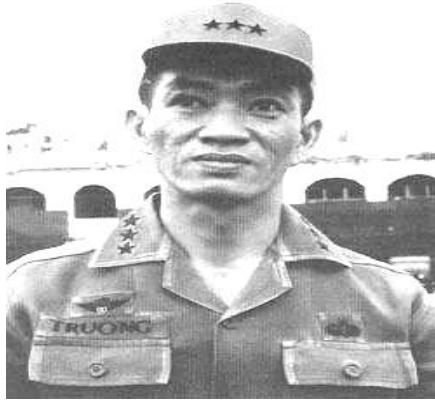
(H: Trung Tướng Ngô Quang Trưởng).