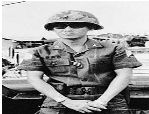
(H: Thiếu Tướng Lê Minh Đảo - chỉ có hình 1 sao).

Sau khi Quân Khu II và Quân Khu I triệt thoái không thành công, các đơn vị tinh nhuệ của QLVNCH nay bị tan tác và quân số khiên dụng của 2 Quân Khu này không còn được một nửa, khí thế chiến đấu giảm sút đáng kể, tinh thần suy sụp... Quân của các đại đơn vị CSBV tự do di chuyển từ vùng vĩ tuyến 17, vùng cao nguyên và con đường mòn Hồ Chí Minh rộn rịp chuyển quân vào Quân Khu III như chỗ không người. Nhiều sư đoàn chính quy của CSBV sau khi "bôn tập" về vùng Xuân Lộc - Long Khánh, CSBV quyết "nhỏ" mặt trận này để chúng nhanh chóng tiến quân thẳng về Thủ Đô Sài Gòn. Những trận mưa pháo ngày đêm của cộng quân rót vào Xuân Lộc, tỉnh lỵ Long Khánh, nơi có sự hiện diện của Sư Đoàn 18 Bộ Binh dưới quyền chỉ huy của Thiếu Tướng Lê Minh Đảo.