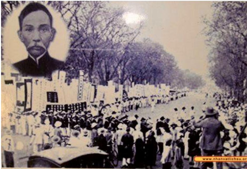
Đám tang Phan Chu Trinh tại Sài gòn ngày 26.03.1926.

Nay muốn một ngày kia nước Việt Nam được tự do độc lập, thì trước hết dân Việt Nam phải có đoàn thể đã.