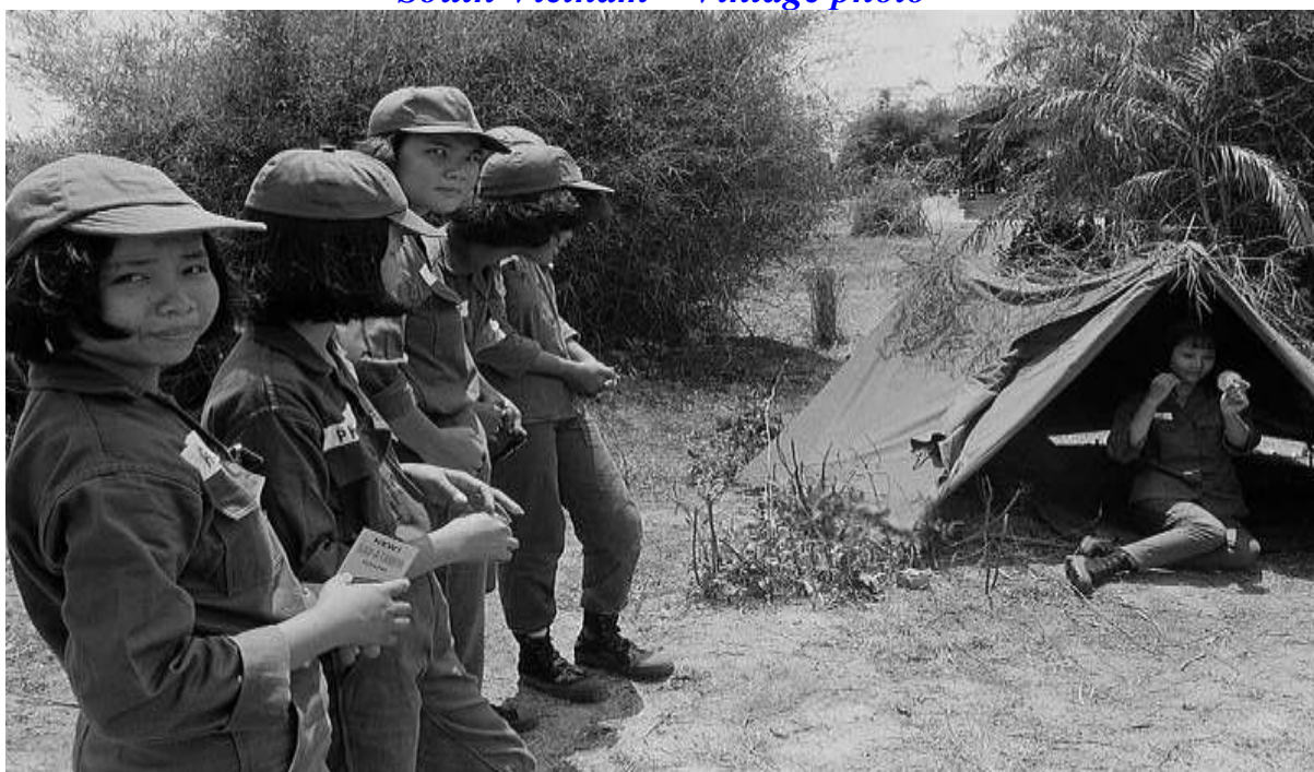
30/04/1968, TTHL Quang Trung, Nam Việt Nam — Các nữ quân nhân Việt Nam trải qua các hoạt động huấn luyện quân sự tại một trại nữ. — Hình ảnh của: bản quyền: Christian Simonpietri / Sygma / Corbis 30 tháng 4 năm 1968