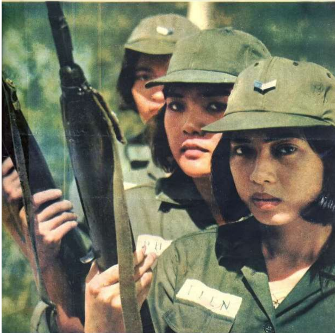
Chiến Sĩ Cộng Hòa 1-3-1966 – Nữ quân nhân Nam VN