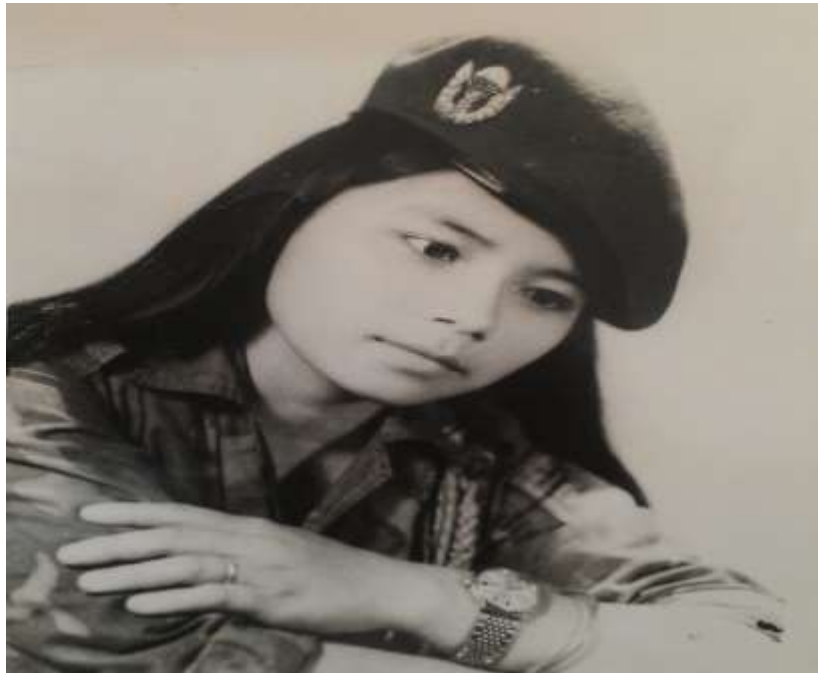
Nữ quân nhân Liên đoàn 81 BKND

http://phailentieng.blogspot.com/2023/07/hinh-xua-nu-quan-nhan-va-quan-truong.html#more