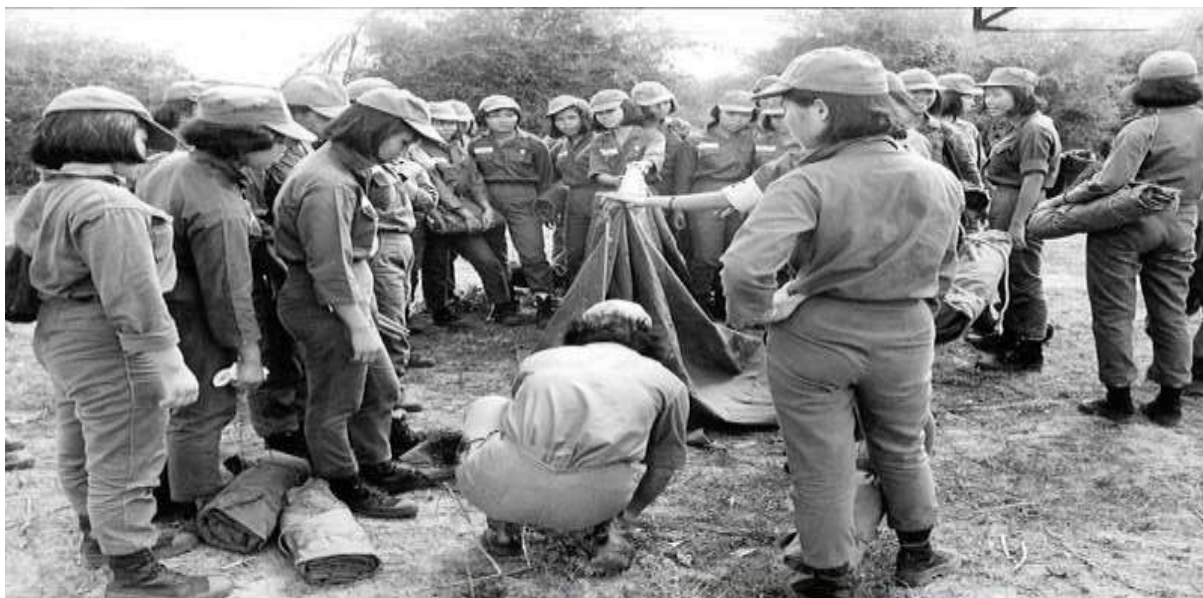
A GROUP OF South Vietnam's 3,000 volunteer women soldiers erecting tents at a military school. Though their training is intensive—including learning to march and shoot—the women work behind the lines, mostly on administration.