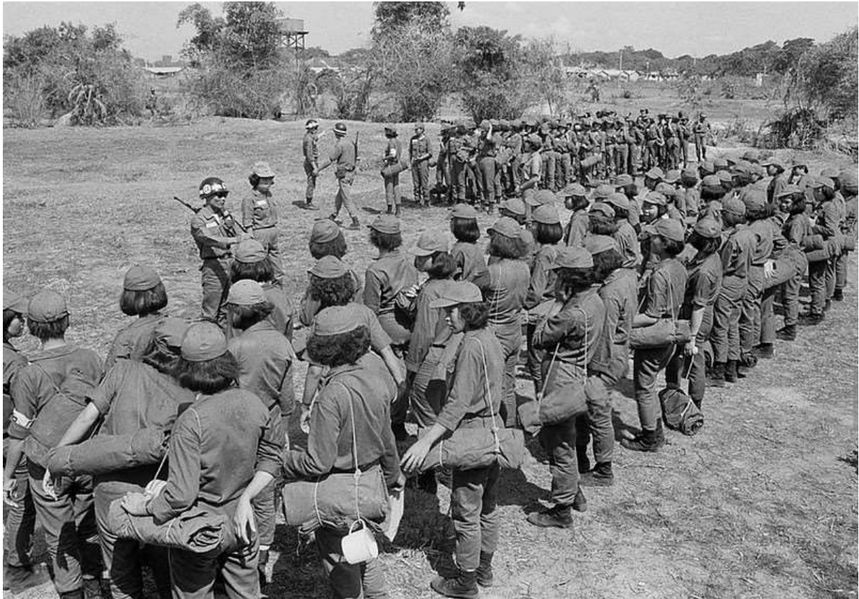
Vietnamese Military Training Camp for Women