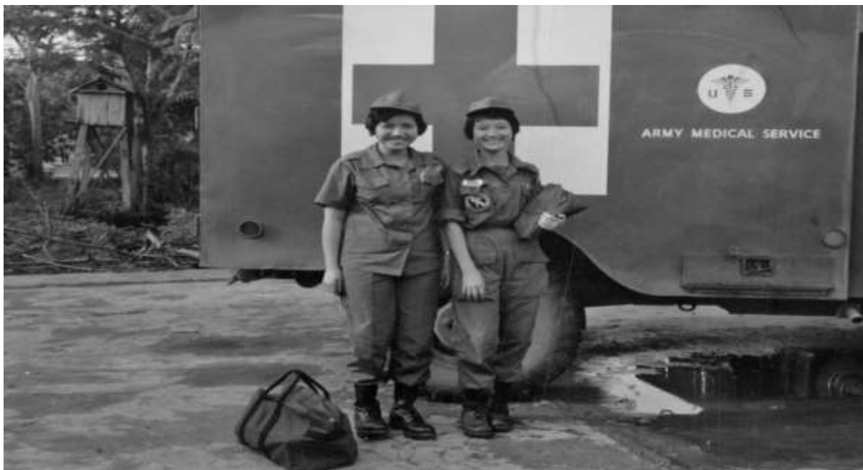
Hai nữ quân y cứu thương trên chiến trường.

Tạm dịch : Các cô gái mặc đồng phục màu xanh nước biển trong hình đang tuyên thệ làm quân nhân tình nguyện trong buổi lễ mãn khóa hôm thứ ba tại Sài Gòn của chương trình huấn luyện quân sự dành cho phụ nữ của Nam Việt Nam. Khoảng 600 cô gái trẻ đã hoàn thành một khóa huấn luyện quân sự kéo dài một tháng và sẽ được gửi đi chiến đấu chống các du kích quân VC.