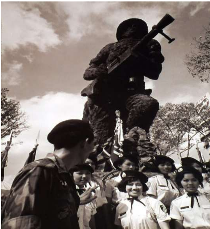
SAIGON 1968 – Nữ quân nhân.