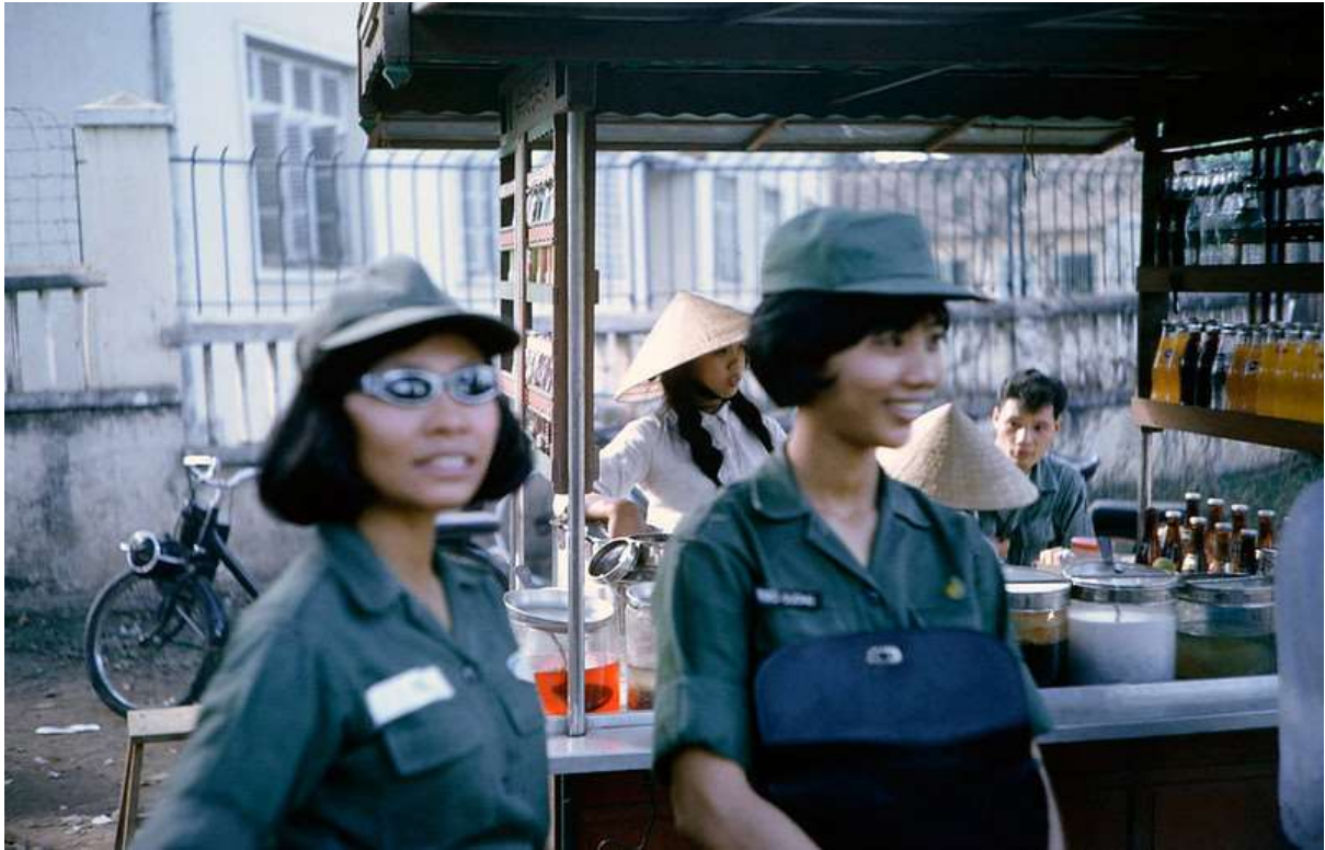
Hai nữ quân nhân Nam VN tại một xe nước giải khát.