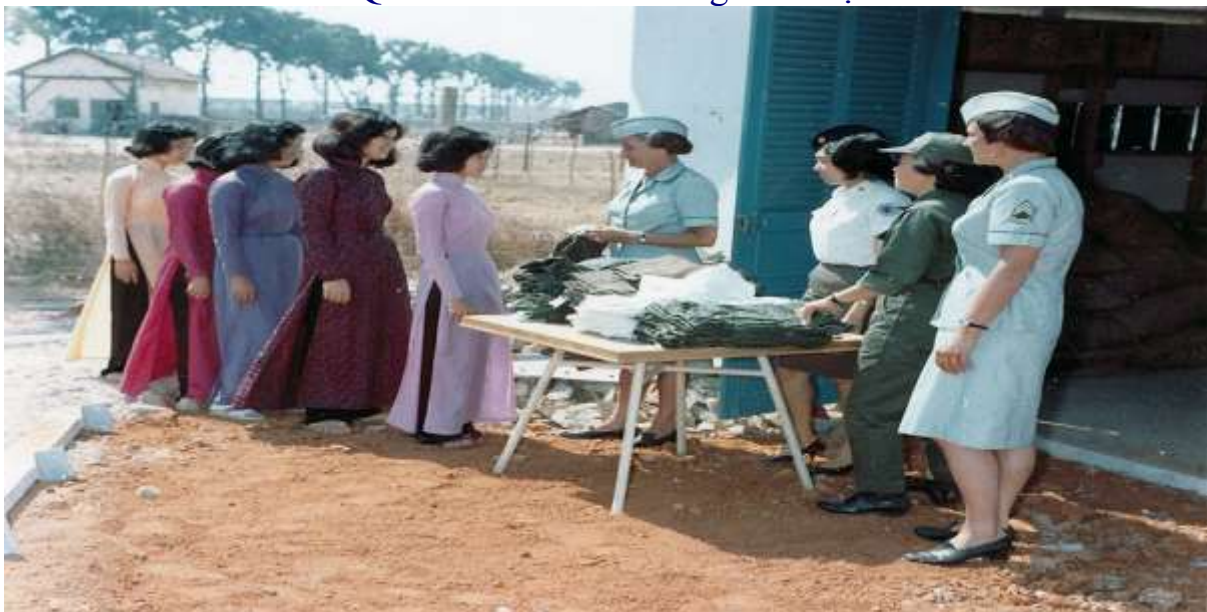
VietNam. January 15, 1965

Thánh tổ của Đoàn Nữ Quân Nhân là Nữ Tướng Bùi Thị Xuân