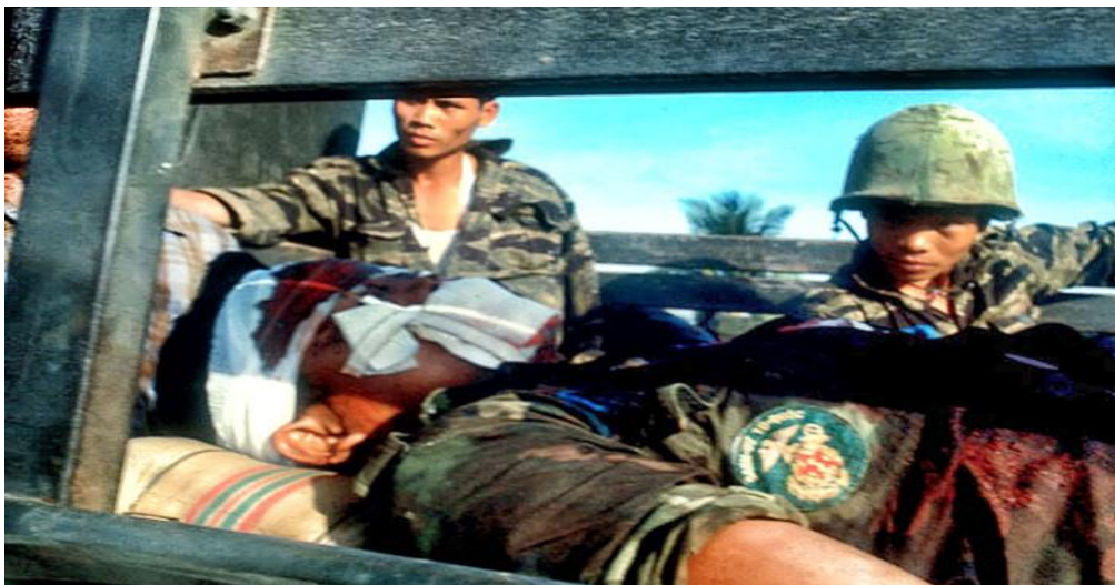
Danh dự -Tổ quốc: Một chiến sĩ Thủy quân lục chiến VNCH bị thương trong cuộc chiến đấu bảo vệ người dân Sài Gòn chúng trong cuộc tổng công kích Tết Mậu Thân 1968.

Thứ ba, tôi thành thật xin lỗi các bác, các anh chị, công chức chính phủ và toàn thể các chiến sĩ, sĩ quan quân lực Việt Nam Cộng hòa đã hy sinh để bảo vệ tự do – trong gần 21 năm, 1954-1975 – và đời sống của người dân miền Nam Việt Nam. Tôi rời Sài Gòn, du học từ cuối năm 1967, nên không có công lao gì trong công cuộc chiến đấu đầy xương máu chống cộng sản xâm lược từ phía Bắc. Có quá nhiều tấm gương hy sinh quả cảm của sĩ quan và binh sĩ quân lực Việt Nam Cộng hòa mà tôi không biết đến, đó là lỗi lầm và thiếu sót của tôi. Đến nay nhờ thông tin quảng bá trên mạng lưới Internet và qua thông tin cặn kẽ từ nhiều trang báo mạng hải ngoại mà tôi mới thực sự hiểu nỗi thống khổ và hy sinh của các anh chị, các bác trong hàng ngũ quân cán chính Việt Nam Cộng hòa.