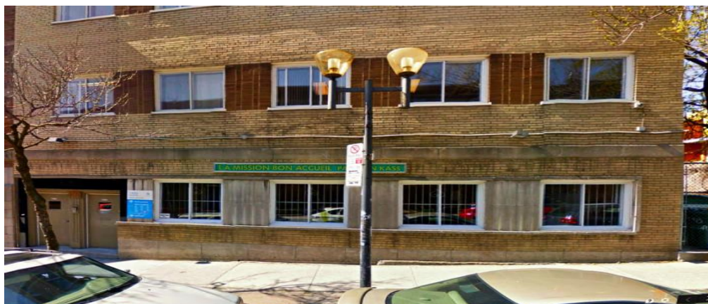
1450 Rue Beaudry, Montréal H2L 3E5:

Trụ sở kinh tài của Hội VKĐK thời Việt Nam bị cấm vận đến khi tan vỡ (1984-1990).