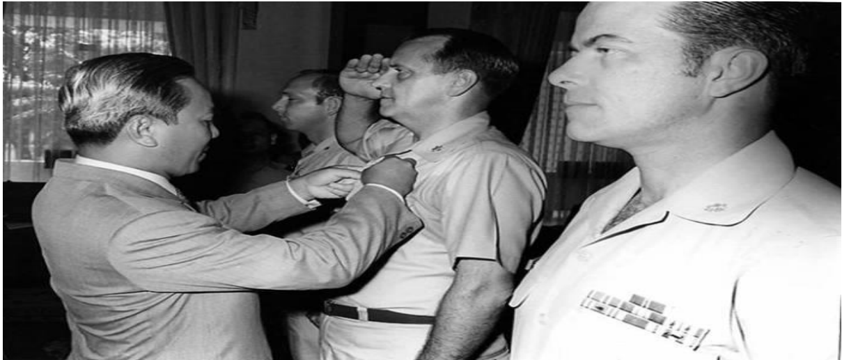
Tổng Thống trao tặng huy chương cho Sĩ Quan HLV Dignitary Protection (14Nov70.)