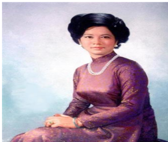
Phu nhân Tổng Thống VNCH Nguyễn Văn Thiệu

Trách nhiệm khối Cận Vệ là bảo vệ vị nguyên thủ quốc gia bao gồm luôn cả gia đình, vì nếu có việc không may xảy ra cho gia đình thì vị nguyên thủ cũng không thể an tâm để lo đại sự.