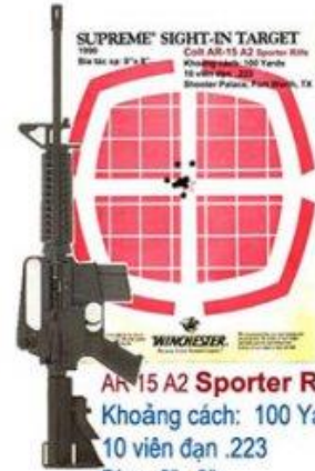
AR 15 A2 Sporter Rifle Khoảng cách: 100 Yards 10 viên đạn .223 Bia : 8"x 8" Shooter Palace, TX.