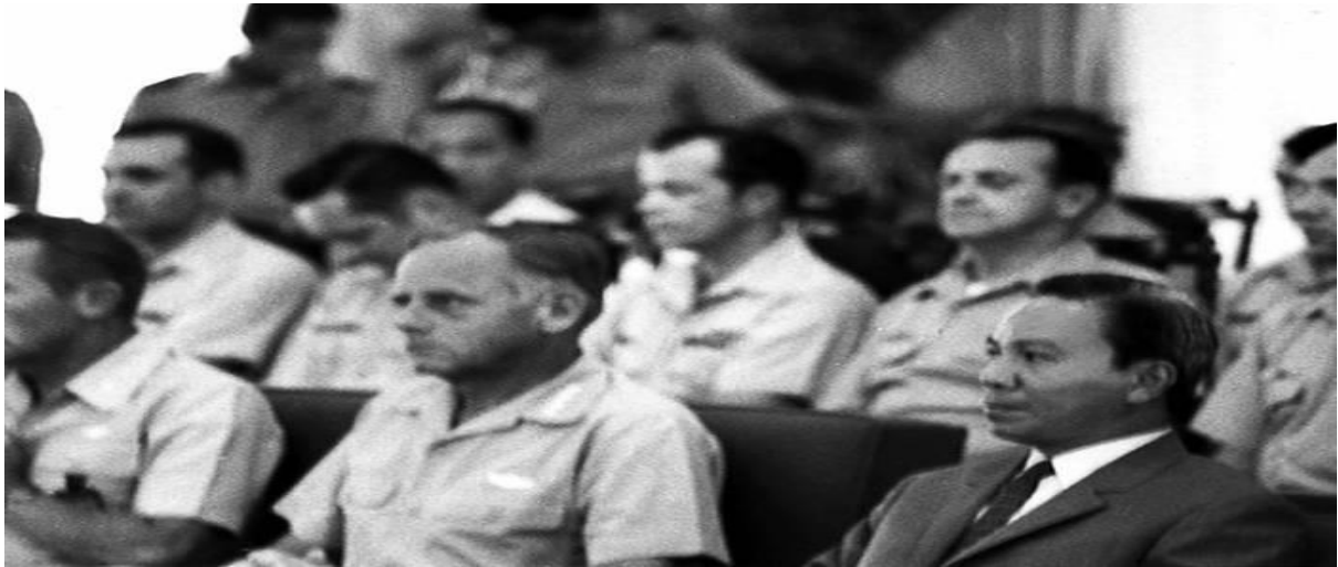
Tổng Thống VNCH và Đại Tướng Tư Lệnh Đệ Thất Không Lực HK. chủ tọa lễ mãn khóa Dignitary Protection (BVYN)

Dignitary Protection Course, do OSI (Office of Special Investigations) huấn Luyện cho nhân viên Khối Cận Vệ Phủ Tổng Thống.