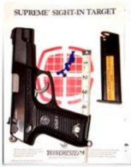
1- Ruger P85 9mm USA Khoảng cách: 15 Yards 15 viên đạn 9mm Bia : 4"x 4" Shooter Palace, TX.