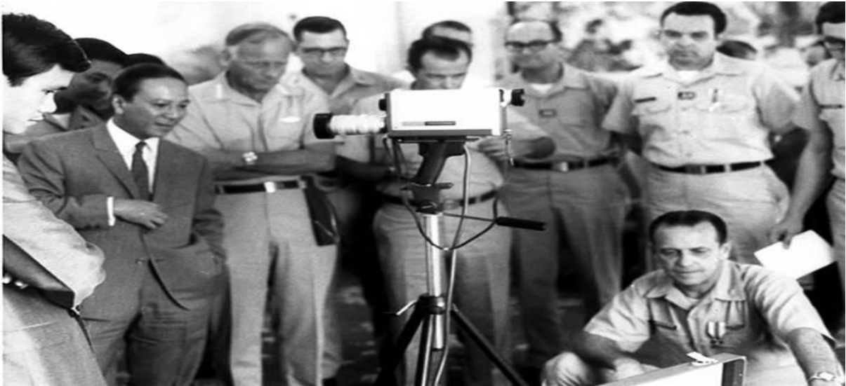
Cơ Quan OSI Trao tặng Tổng Thống dàn máy Closed Circuit Monitor. (14 Nov 70).