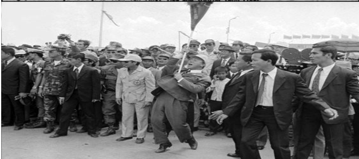
TT Nguyễn Văn Thiệu trong ngày lễ ban hành luật Người cày có ruộng. 26/3/1973

Tóm lại tùy theo tình hình an ninh nơi đó mà ấn định công tác nếu thấy cần thiết sẽ tạo thêm những vòng “lá chắn” Cận Vệ chung quanh vị Tổng Thống.