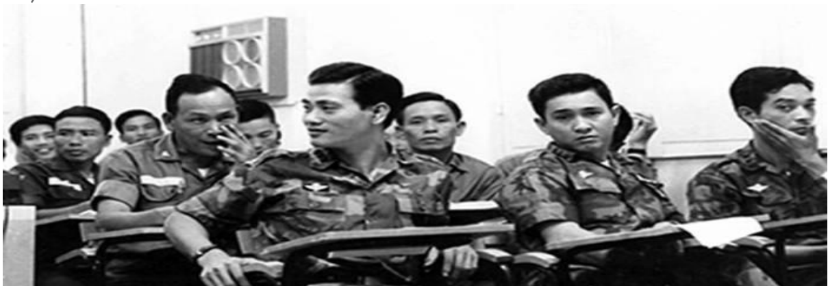
Nhân viên CV các cấp trong buổi Giảng Lý Thuyết, (06 Nov1970.) Distinguished Visitor Protection Course, (Huấn luyện cho Cảnh Sát Quốc Gia.)