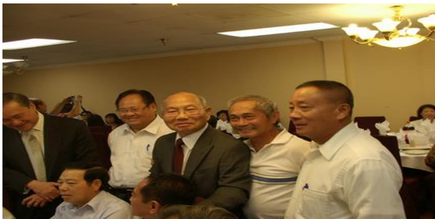
Những con Mãnh Hồ năm xưa....