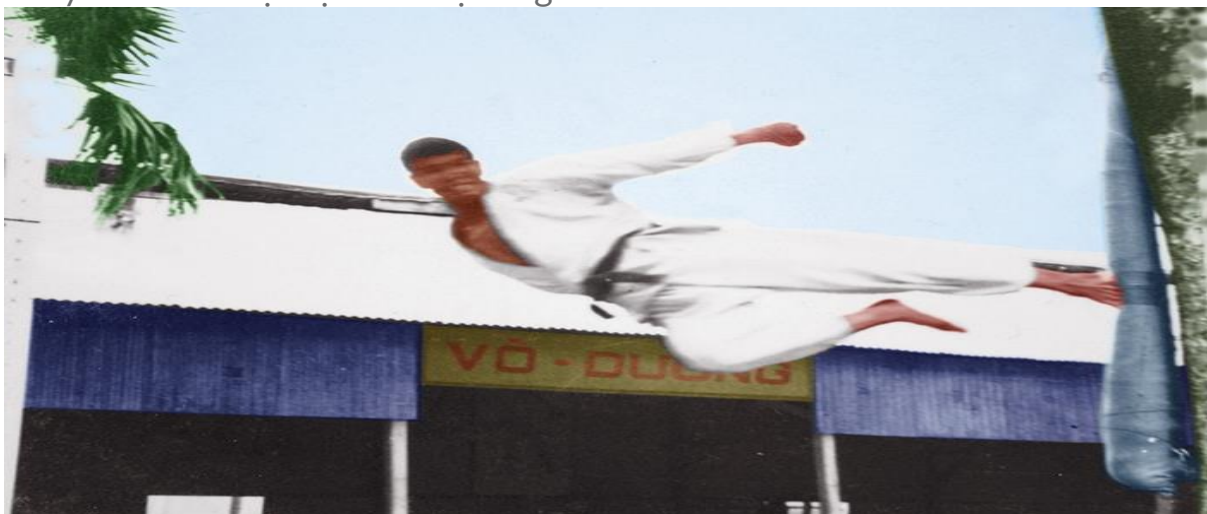
Đá bay trên mục tiêu bất động.