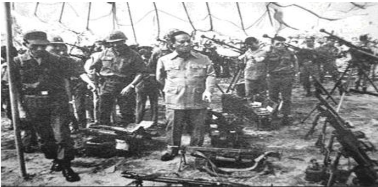
Tổng Thống Thiệu thị sát mặt trận.

Thành phần Cận Vệ Viên là những cảm tử quân, với lý tưởng Tổ Quốc, Trách Nhiệm và Danh Dự của quân nhân, khi hữu sự họ trở thành những “tấm lá chắn” bằng xương bằng thịt của mình để che chở và bảo vệ cho vị Nguyên Thủ Quốc Gia cũng là Tổng Tư Lệnh Tối Cao của Quân Lực Việt Nam Cộng Hoà và gia đình của TT.