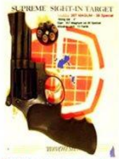
2- Llama Spain. 4" Khoảng cách: 15 Yards 15 viên đạn 357 Magnum Bia : 6"x 6" Shooter Palace, TX.