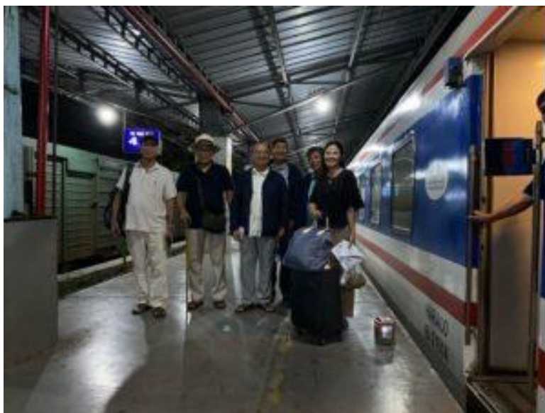
háo hức, chưa tới giờ đã chen vào toa

Thôi trở lại chuyến đi Tuy Hoà của mình nhe. Chỉ xin chia sẻ vài hình ảnh như thường lệ thôi.