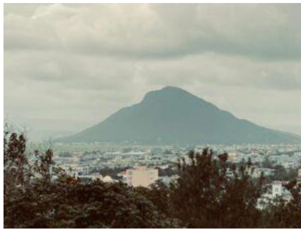
Núi Chóp Chài nhìn từ Tháp Nhạn.