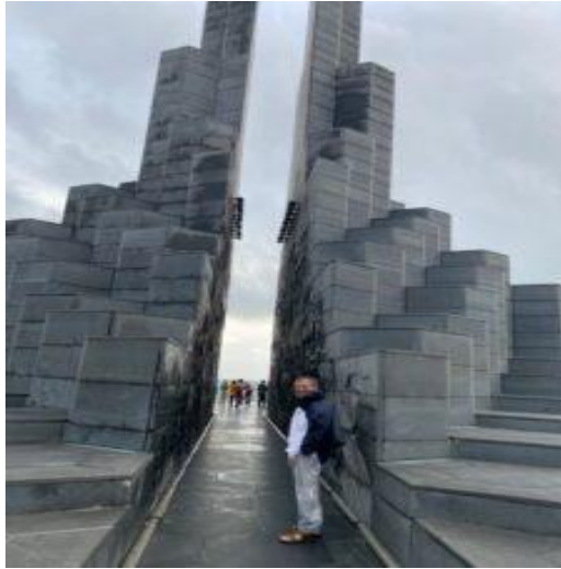
Nghinh Phong, mùa gió bắc muốn bay cả người...